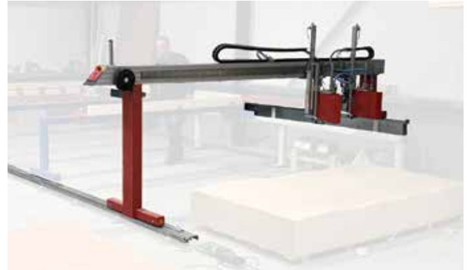
Boden- und Tischmontage (auf Anfrage)